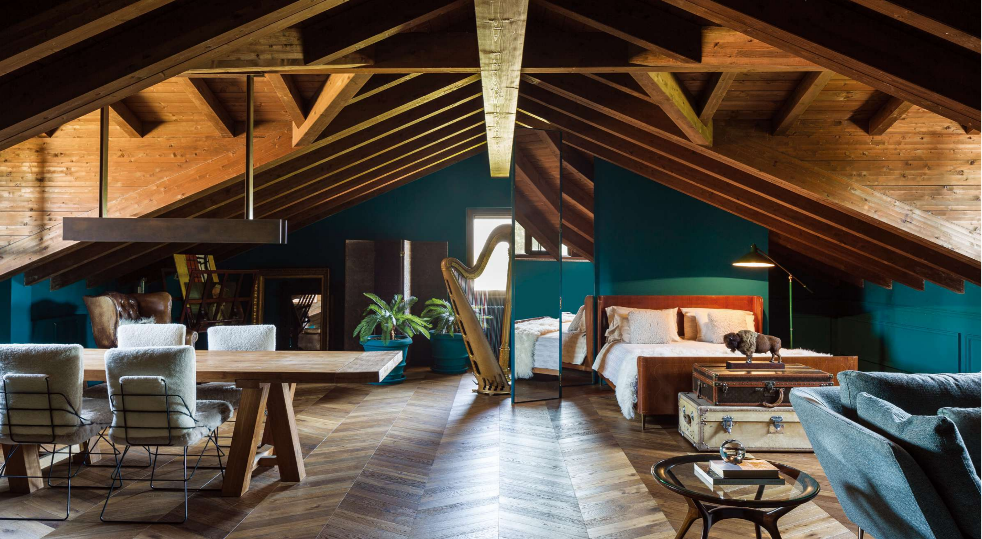
밀라노 외곽에 자리한 집은 다락방처럼 꾸민 최상층 덕분에 전원 속 고택처럼 느껴진다. 게스트 룸으로 운치 있게 꾸민 이 공간은 모던 앤틱 스타일을 지향하는 집주인의 취향이 집약된 곳으로, 특히 하프는 럭셔리하고 유서 깊은 느낌을 표현하는 데 효과적인 수집품 중 하나다. 네오고딕 스타일 하프는 1911년 에라드(Erard) 제작, 침대는 1950년대 빈티지, 침대 하단에 놓인 트렁크는 각각 1950년대 빈티지, 루이 비통 제품. 왼쪽 코너에 놓인 이젤은 1850년대 영국 빅토리아 시대 앤틱, 트렁크 위에 놓인 동물 조각은 앙리 프라탱 작품. 모두 파인아트 바이 디 마노 인 마노(FineArt by Di Mano in Mano)에서 구입했다.

자인으로 세련된 멋을 추구하는데, 이는 몽클레르의 패션 철학과 일치합니다. 몽클레르 역시 강아지 패션 컬렉션을 사람의 옷과 똑같이 개발하고 싶어 했기에 폴도 도그 쿠튀르와 협업 관계가 되었지요.” 몽클레르의 디렉터로 재직하면서 강아지 패션 브랜드를 운영하게 된 마우리치오는 최근 개인 삶에 있어서 의미 있는 변화를 맞이했다. 그레이트데인(Great Dane) 두 마리와 브라코(Bracco) 그리고 불도그까지 4마리 대형견을 키우며 도심 주거 환경에 한계를 느낀 마우리치오는 오랜 시간 살았던 밀라노를 벗어나 정원이 있는 주택으로 이주한 것. 밀라노