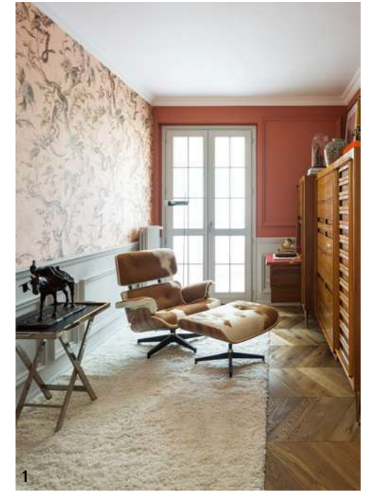
1 홈 오피스는 1950년대 디자인 가구로 단장했다. 송치 가족으로 커버링한 임스 리운지 체어와 그 옆에 놓인 플로어 스탠드 스파이더(Spider)는 조 콜롬보(Joe Colombo) 디자인, 사이드 테이블 위에 놓인 슌마 브론즈 조형은 1880년대 엔틱. 2 코끼리 포슬린 조형물은 이탈리아 조각가 구이도 카차푸오티(Guido Cacciapuoti) 작품, 사이드보드는 1960년대 디자인. 3 도어를 책상으로 활용할 수 있는 우드 캐비닛은 1950년대 디자인으로 홈 오피스를 한층 우아하게 만들어준다. 파인아트 바이 디 마노 인 마노(FineArt by Di Mano in Mano)에서 구입했다.

원으로 구성된 마우리치오의 집은 사람과 동물이 행복하게 지낼 수 있는 최상의 조건을 갖췄다. 홈 오피스는 물론 게스트룸까지 마련되어 업무와 사교 활동 모두 집에서 즐길 수 있고, 너른 정원은 개들을 데리고 밖으로 나가지 않더라도 산책이 가능할 정도다. “여기로 이사 온 후 확실히 일상이 바뀌었어요. 예전보다 일찍 일어나고 출근 전 1시간 정도 개들과 함께 정원에서 놀아주는 게 습관이 되었으니까요. 이렇게 지내다 보니 가끔 제가 도시와 멀리 떨어진 시골에 살고 있다는 착각에 빠지곤 합니다.” 근 1년간 마우리치오가 공동여 손수 개조한 집은 그의 자아가 고스란히 투영된 창작물이라 해도 과언이 아니다. 애견인으로서 반려견의 쾌적한 환경을 위해 만든 정원, 크리에이티브 디렉터로서 직접 디자인한 벽지로 단장한 공간 그리고 열정적인 아트&디자인 컬렉터로서 자신만의 기준에 따라 선별한 가구와 소품으로 연출한 인테리어 스타일은 한 인간이 지닌 다채로운 감성과 개성을 고스란히 보여주기 말이다. 이런 의미에서 앞으로 지속될 마우리치오의 수집 활동과 커리어가 이 집을 어떻게 변화시켜 나갈지 자못 궁금한 바. 집주인은 이에 대해 한 가지 변함없을 사실을 이렇게 설명한다. ‘우아함의 진수를 인식한 사람만이 알아볼 수 있는 우아한 집’이라는 본질은 바뀌지 않을 거라 말이다. [4]